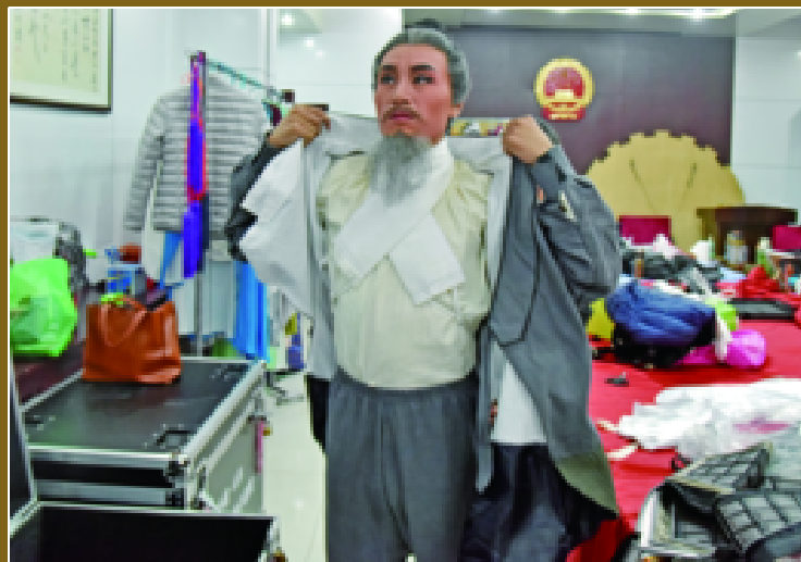
穿上服装准备上台